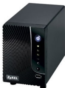
Server di Storage NSA-220 Plus

accesso alla rete di ogni utente che ha sottoscritto il servizio, fornendo data e ora di collegamento, indirizzo IP sorgente e la porta di destinazione. Le informazioni registrate dallo ZyXel N4100 possono essere così trasferite ed archiviate automaticamente sull'unità di storage NSA-220 Plus collegato alla rete locale.